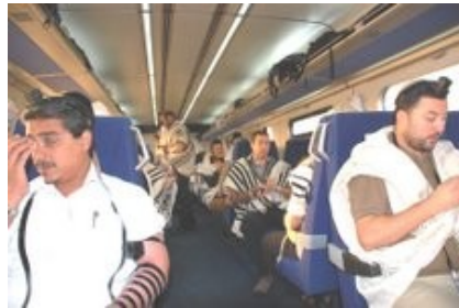
תפילה ברכבת מבית-שמש