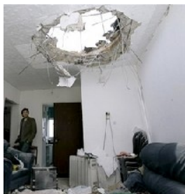
טיל פגע בבית באשקלון